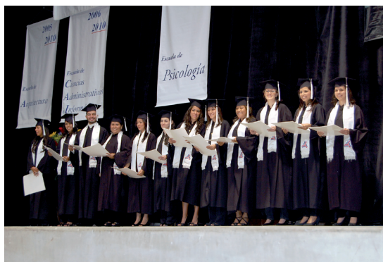
Graduación de la 4ª generación de la carrera de Psicología.

Por último, no queremos dejar de señalar que este número de la revista ConSciencia presenta materiales de alta calidad y de sumo interés para el estudiante y el profesional de la psicología.