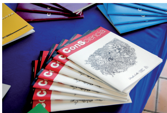
Presentación del número 12 de la revista ConSciencia.