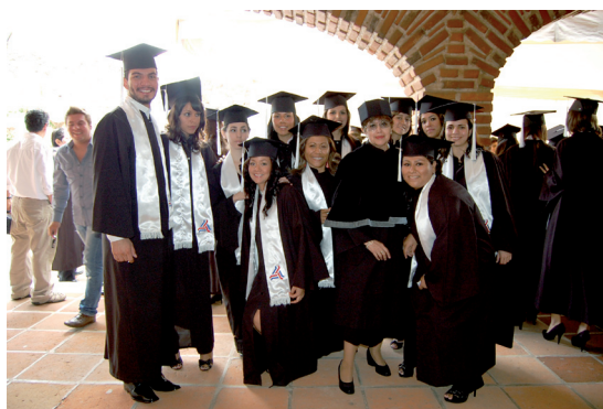
Graduación 4ª generación de la carrera de Psicología