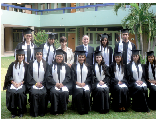
Foto de la 4ª generación de Psicología.

Los alumnos de sexto semestre que llevaron a cabo su Práctica de Integración V, y cuyo objetivo era hacer observaciones e intervenciones a partir de la psicología organizacional e institucional, se desempeñaron en diversos centros e instancias tales como instituciones dedicadas a la atención a personas de la tercera edad, personas con capacidades especiales, servicios de salud, centros de investigación y organizaciones no gubernamentales, entre otros. Fue importante constatar que los estudiantes lograron hacer reflexiones sobre la psicología organizacional y las instituciones en escenarios que no resultaban típicos para este tipo de actividades pero que, sin embargo, los objetivos de la práctica se lograron y fueron satisfactorios.