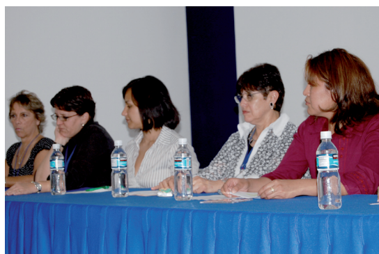
5ª Jornada de Psicología: Panel sobre violencia.