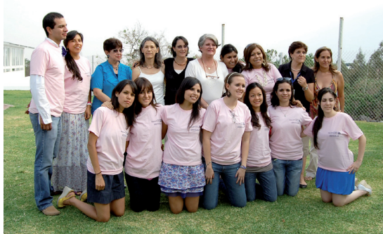
Despedida de la 4ª generación en Psicología el día del psicólogo el 22 de mayo.